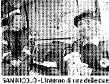
SANNICOLÒ - L'interno di una delle due ambulanze per il trasporto di bambini