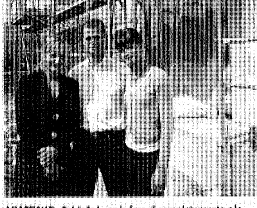
AGAZZANO - Ca' della Luna in fase di completamento e la famiglia proprietaria dell'innovativa abitazione